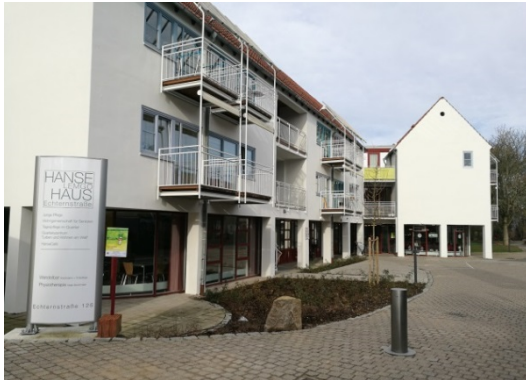
EUTB Beratungs-Stelle Lemgo im Hanse Haus