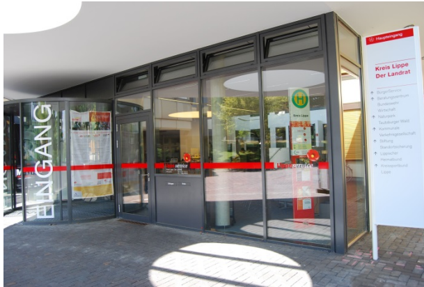
EUTB Beratungs-Stelle im Kreis-Haus