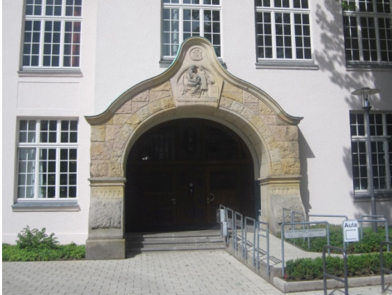
EUTB Beratungs-Stelle Detmold in der Alten Schule am Wall